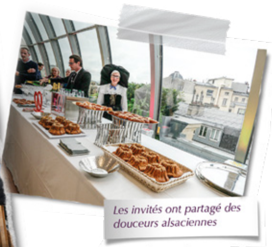
Les invités ont partagé des douceurs alsaciennes