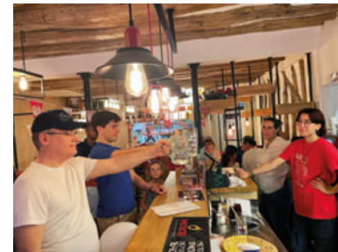
Le lever de verre : bientôt discipline olympique ?

bonne orthographe de mots alsaciens, jeu du vin mystère ; des lots sont venus récompenser les esprits (ou les bras) forts.