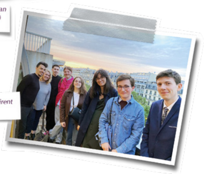
Les boursiers 2023 admirent les toits de Paris