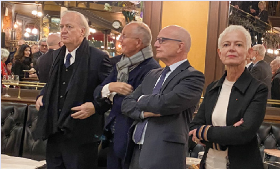
Denis Kessler (1 er en partant de la gauche) était encore parmi nous pour fêter la Saint Nicolas le 5 Décembre.

Notre association vient de perdre un ami fidèle : originaire de Mulhouse, Denis Kessler était un grand économiste, un grand professionnel de l'assurance, et un grand ami de l'Alsace, demeurée si chère à son cœur ! L'association perd une personnalité hors du commun : d'une grande culture, Denis a d'abord été un intellectuel brillant, avant de se lancer dans l'assurance. D'abord comme Président de la Fédération Française des Sociétés d'Assurance, puis comme entrepreneur en prenant la direction de la société de réassurance SCOR, et en la hissant au niveau des plus grands réassureurs mondiaux.